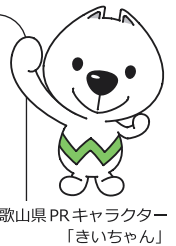
和歌山県PRキャラクター 「きいちゃん」