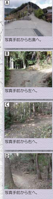
A 写真手前から右奥へ。 B 写真手前から左へ。 C 写真手前から右へ。 D 写真手前から左へ。

3 ことだしじょうどう 神田地蔵堂 平家の武将、斎藤茂頼を祭う女官「横笛」が、恋人に一目逢いたいこの地藏堂までやってきたという。二人の恋は「平家物語」に描かれている。 4 やたてすなごねじょう 矢立砂埋地蔵 弘法大師が高野山を開山した際、自ら地藏を造って村人の無病息災を祈願したという。 5 やかじんじや 八坂神社 修行中の弘法大師がこの地に立ち寄った際に建立したといわれている。祭神は須佐之男命。