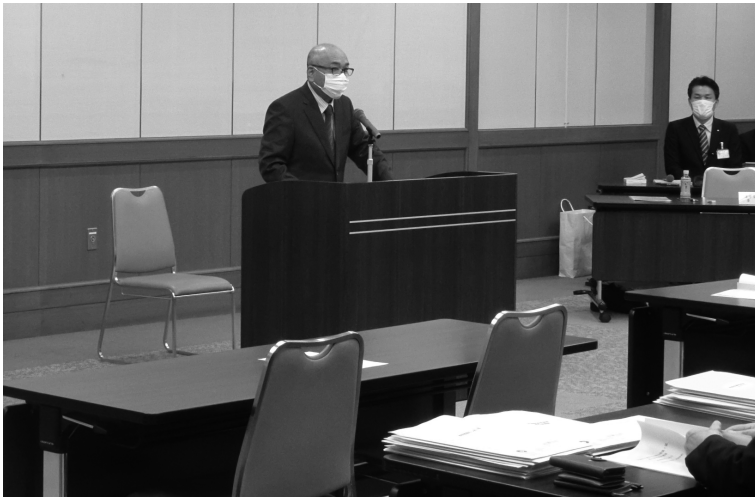
立候補予定者説明会