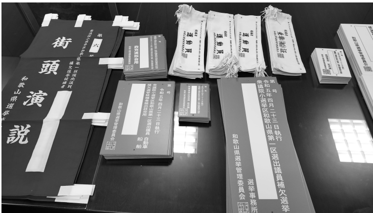
候補者等に交付する 選挙運動用物資