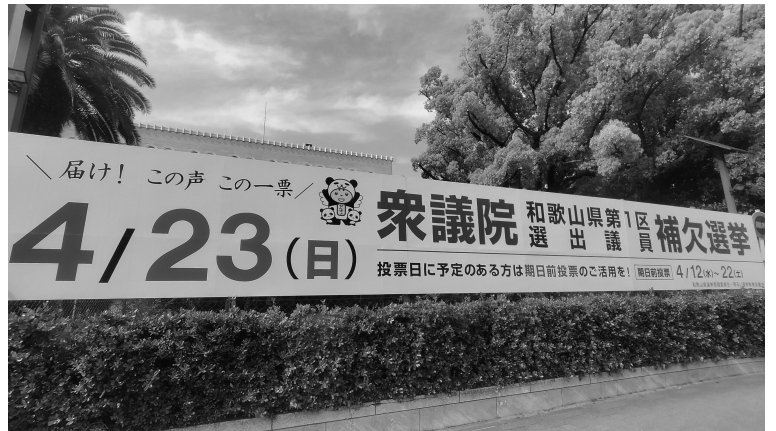
立看板を用いた啓発