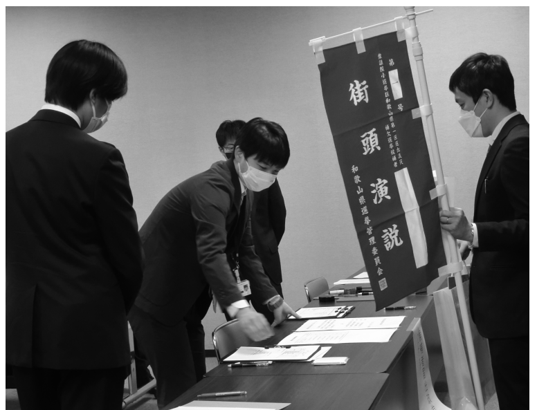
立候補受付 リハーサル