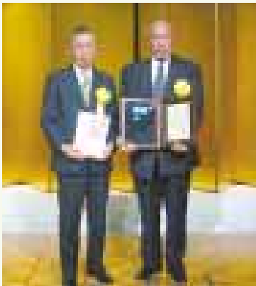
(表彰式、東京都千代田区)

磯の浦自治会は、平成18年度第11回防災まちづくり大賞(一般部門)の消防庁長官賞を受賞しました。防災まちづくり大賞は、地域防災力の向上を目的として、地方公共団体や自主防災組織、事業所等が行っている防災