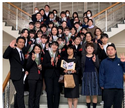
たくさんの御祝電をありがとうございました。

新たな気持ちで一歩前進した卒業生の皆さん本当におめでとう。皆さんの飛躍を心から祈っています。ガンバレー