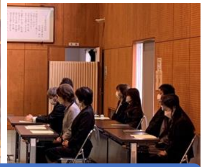
卒業証書授与 ご来賓の皆様と教員も見守ります