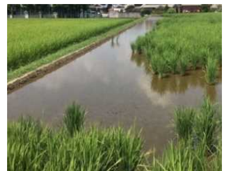
食害を受けやすい 入水口・排水口や周縁部（畦際付近）