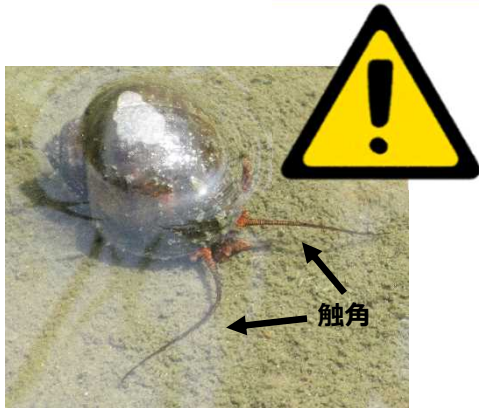
ジャンボタニシ（スクミリングガイ）