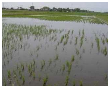
移植直後に食害を受けた移植苗