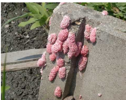
用水路（水口）の卵塊