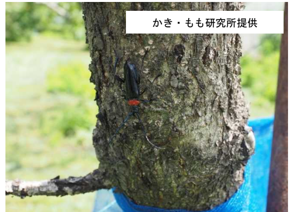
かき・もも研究所提供