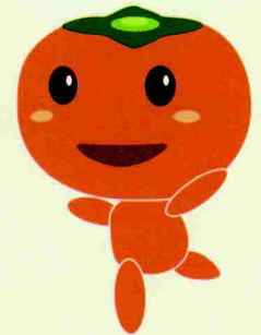
「かきたん」 和歌山県食育キャラクター